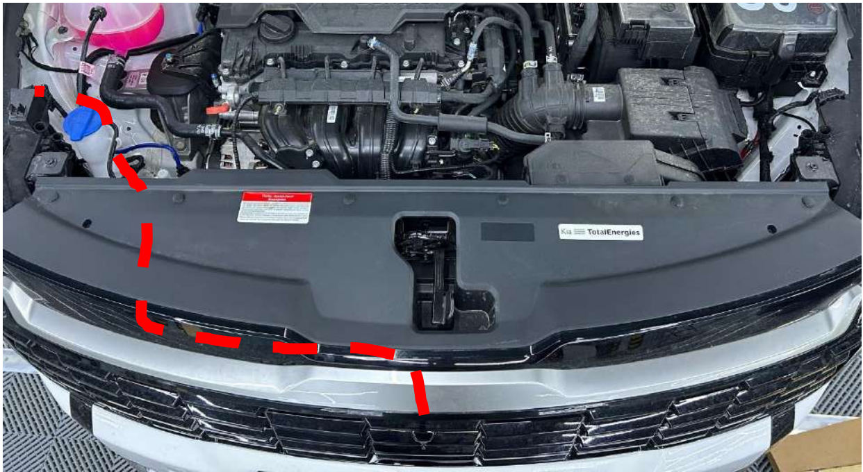
Схема расположения шланга.