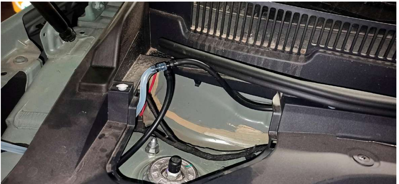
Рисунок 5. Подключение к омывателю лобового стекла