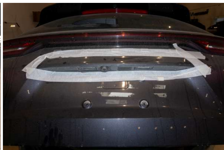
Рисунок 2 – Защитные действия