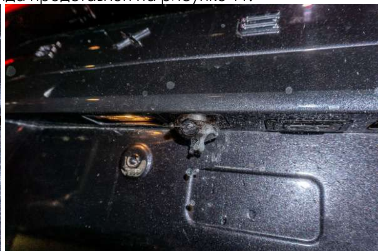
Рисунок 11 – Общий вид омывателя