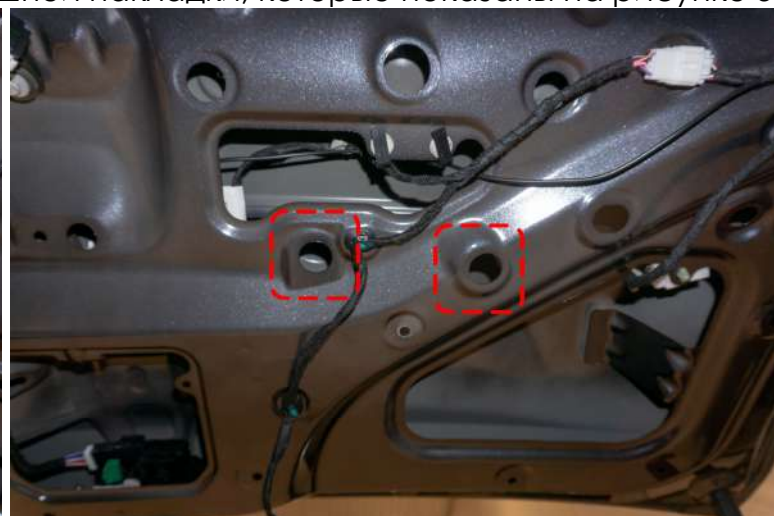
Рисунок 5 – Расположение гаек крепления внешней накладки