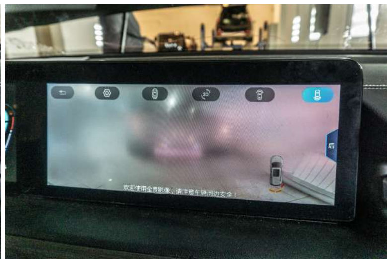
Рисунок 12 – Общий вид на экране монитора