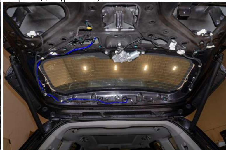
Рисунок 10 – Расположение трубки в багажном отделении