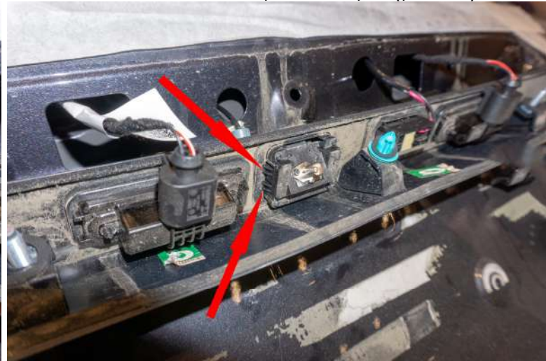
Рисунок 7 – Расположение фиксаторов корпуса камеры

6. Снять камеру заднего вида с корпуса → открутить четыре винта крепления «★Torx 1.5» и два «★Torx 5» (рис. 8).