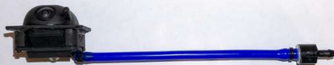
Рисунок 9 – Установка камеры заднего вида в корпус омывателя

2. Установить фитинг тройник в разрыв трубки на подачу жидкости заднего стекла, места соединений зафиксировать. Проложить трубку к месту подключения форсунки омывателя → трубку зафиксировать к штатным жгутам электропроводки (рис. 10).