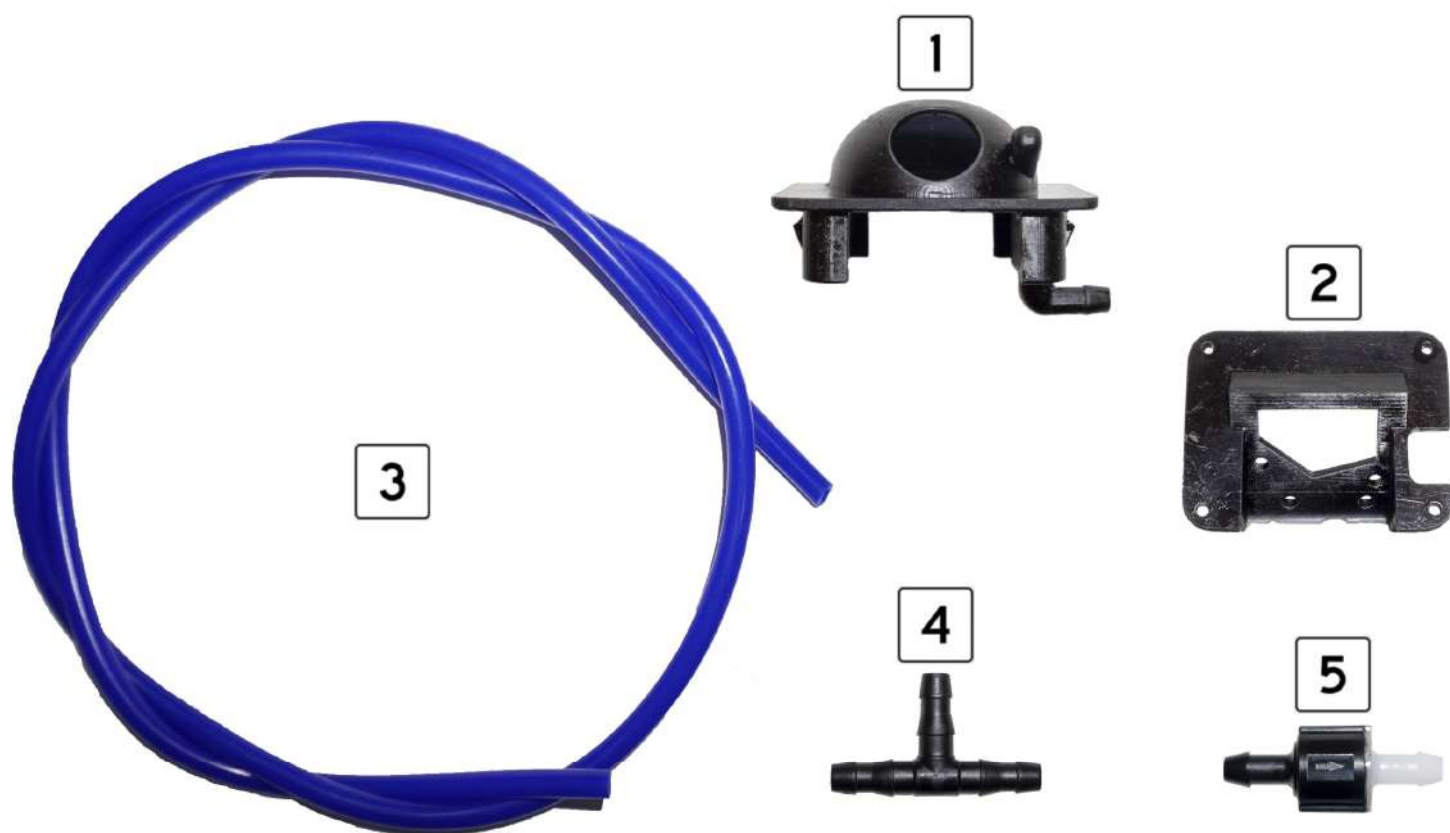
Рисунок 1 – Комплект поставки

В комплект поставки входят следующие элементы (рис. 1):