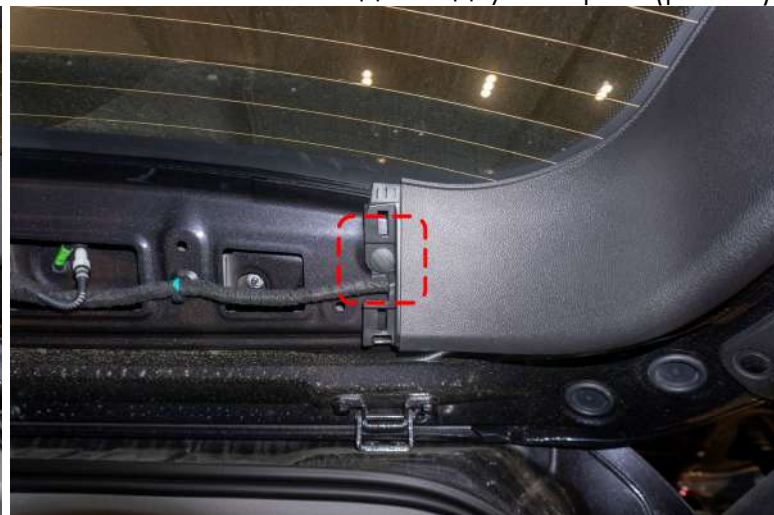
Рисунок 3 – Расположение декоративной накладки двери

2. Открутить винт крепления «+PH2» центральной накладки → снять центральную накладку совместно с боковыми, отщелкнув клипсы → отсоединить провод питания (рис. 4).