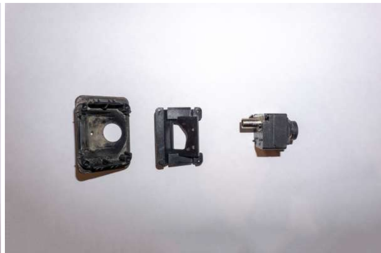
Рисунок 8 – Расположение винтов крепления