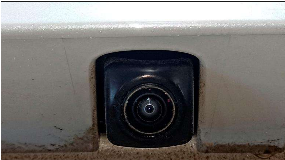
Штатная камера заднего вида