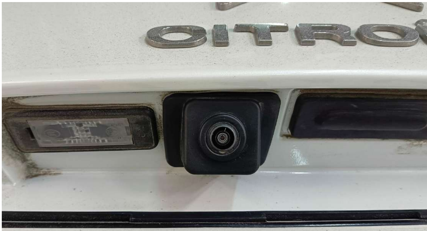
Штатная камера заднего вида