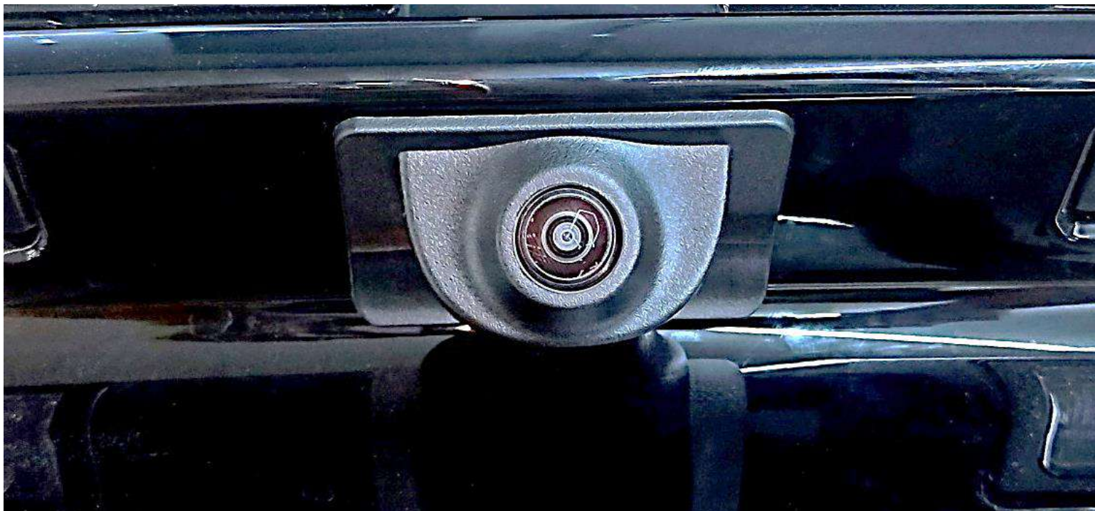
Штатная камера заднего вида