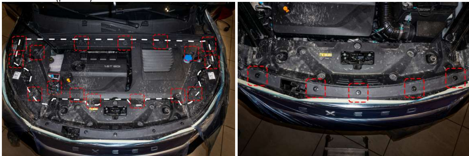
Рисунок 3 – Расположение клипс и винтов крепления

1. Снять защитный кожух в подкапотном пространстве → открыть капот автомобиля → открутить клипсы крепления по периметру. Снять защитную накладку → открутить пять винтов «★Torx 30» (рис. 3).