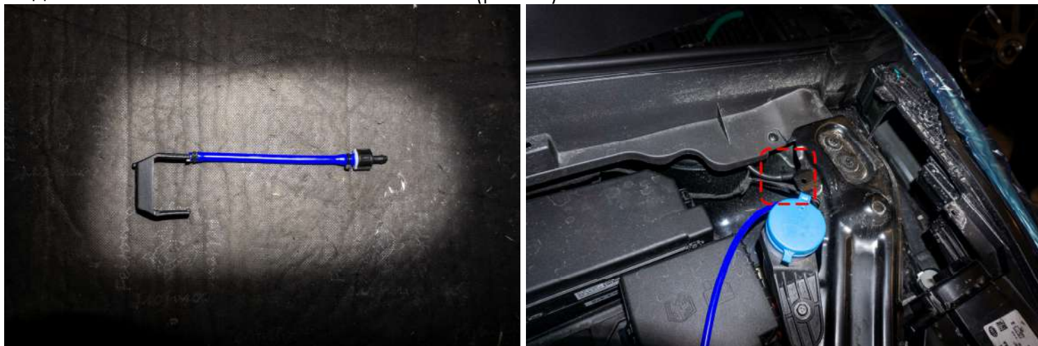
Рисунок 4 – Подготовка к установке омывателя

1. Подготовить к установке омыватель → отрезать трубку длиной не более 10 см, подсоединить к форсунке и зафиксировать → установить обратный клапан. Протянуть трубку к месту подключения омывателя лобового стекла (рис. 4).