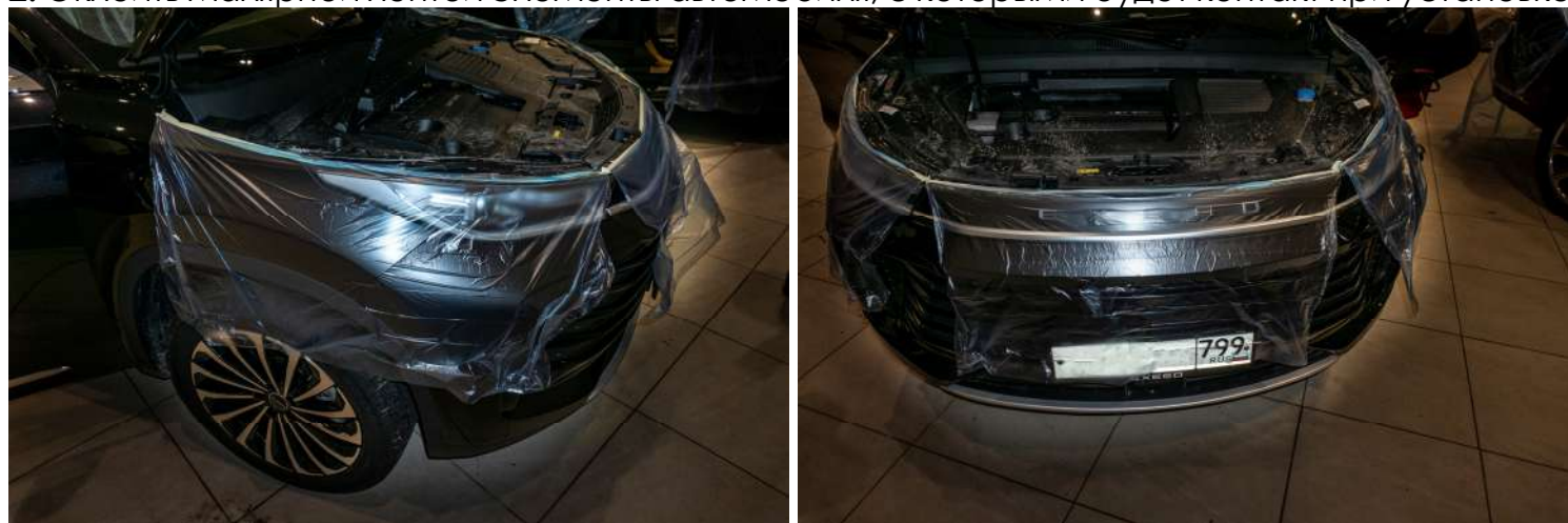
Рисунок 2 – Защитные действия