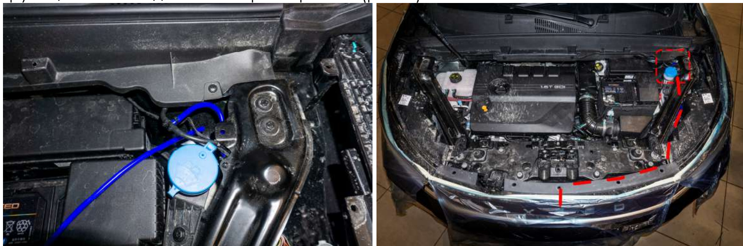
Рисунок 5 – Расположение трубки в подкапотном пространстве

2. Подключить омыватель к штатной системе подачи жидкости на лобовое стекло → трубку зафиксировать к штатным жгутам электропроводки → установить фитинг тройник в разрыв трубки, места соединений зафиксировать. (рис. 5).