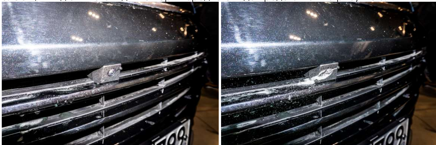
Рисунок 6 – Общий вид омывателя для камеры переднего вида

3. Общий вид омывателя для камеры переднего вида представлен на рисунке 6.