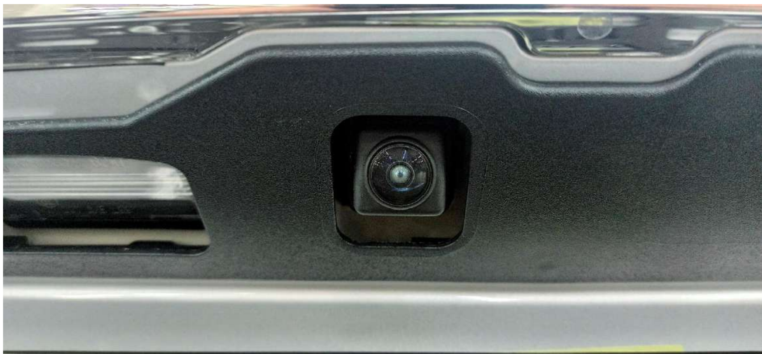
Штатная камера заднего вида