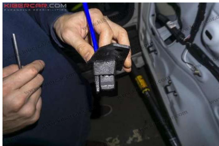
Рисунок 8 - Установка омывателя