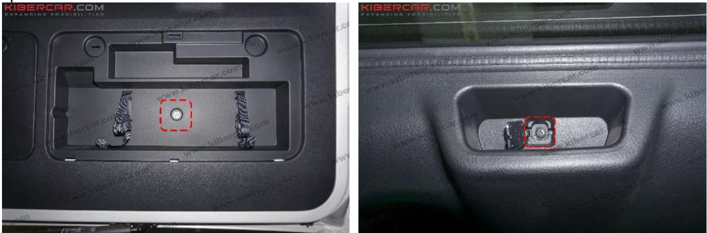
Рисунок 3 - Расположение винтов крепления центральной наклейки

2. Открыть отсек хранения знака аварийной остановки → повернуть фиксаторы → снять накладку. Открутить болт крепления на Ø10 центральной накладке → открутить винт крепления PH2, который расположен в кармане центральной наклейки (рис. 3). Также снять второй отсек хранения.