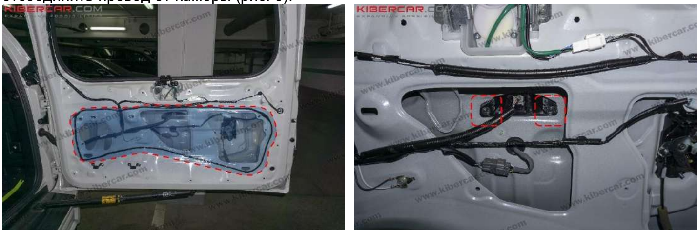
Рисунок 5 - Расположение болтов крепления корпуса задней камеры

4. Снять защитную пленку → открутить болты крепления на Ø10 корпуса задней камеры → отсоединить провод от камеры (рис. 5).