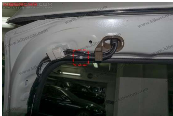
Рисунок 7 - Расположение штатного фитинга

2. Проложить трубку к месту подключения омывателя → трубку зафиксировать к штатным жгутам электропроводки. Подсоединить трубку к омывателю и установить обратный клапан → места соединений зафиксировать (рис. 8).