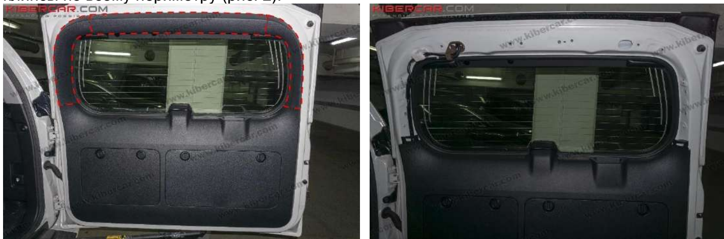
Рисунок 2 - Расположение декоративных накладок двери