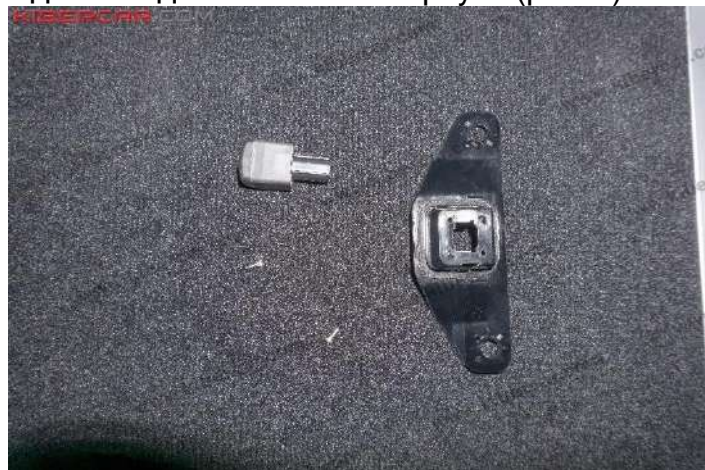
Рисунок 6 - Расположение винтов крепления