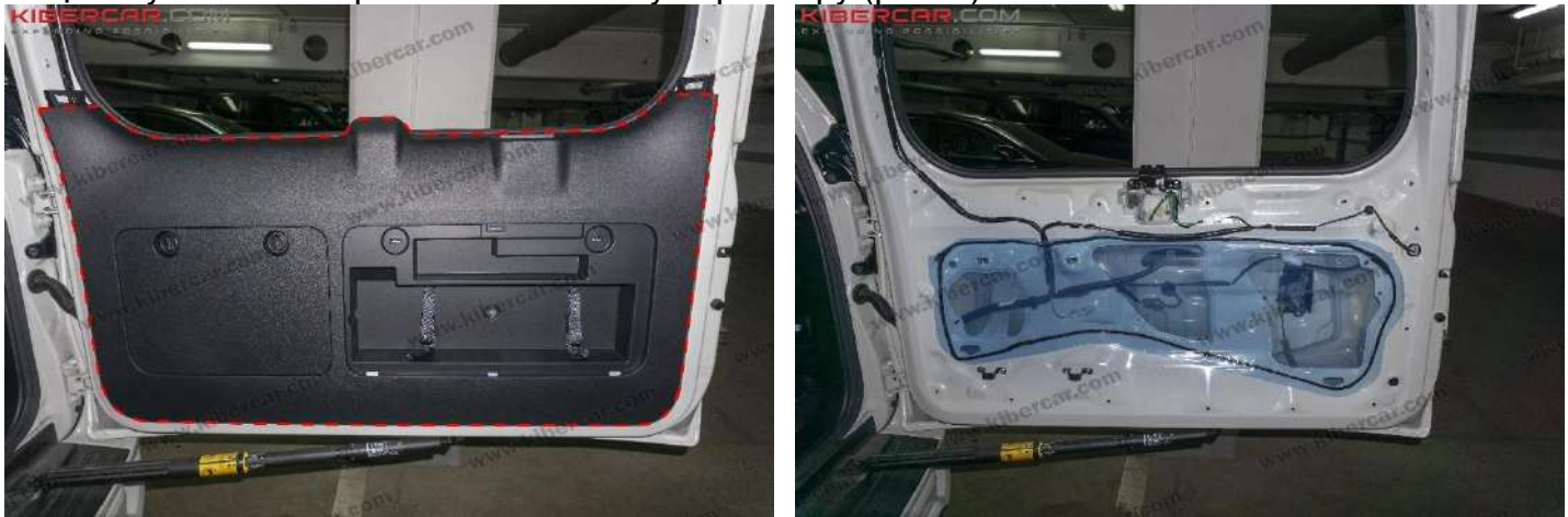
Рисунок 4 - Демонтаж центральной наклейки

3. Снять центральную накладку → поднять заднее стекло, высвободить его с замка → отщелкнуть клипсы крепления по всему периметру (рис. 4).