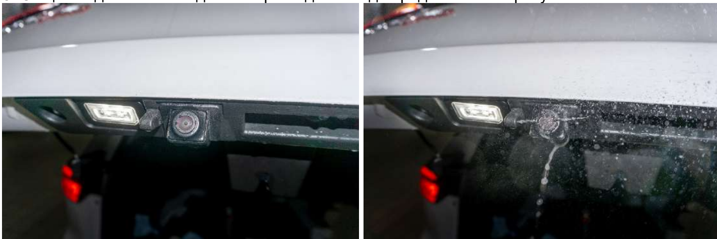
Рисунок 12 – Общий вид форсунки омывателя для камеры заднего вида

5. Общий вид омывателя для камеры заднего вида представлен на рисунке 12.