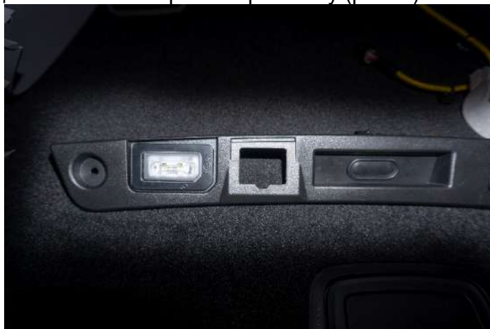
Рисунок 7 – Расположение фиксаторов