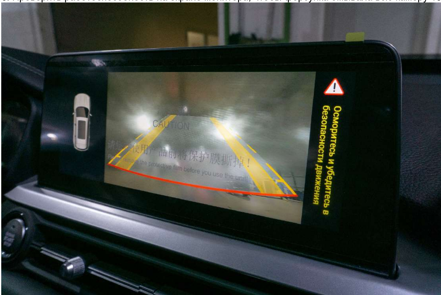
Рисунок 13 – Общий вид на экране монитора

6. Проверить работоспособность на экране монитора, чтобы форсунка омывала всю камеру 13.