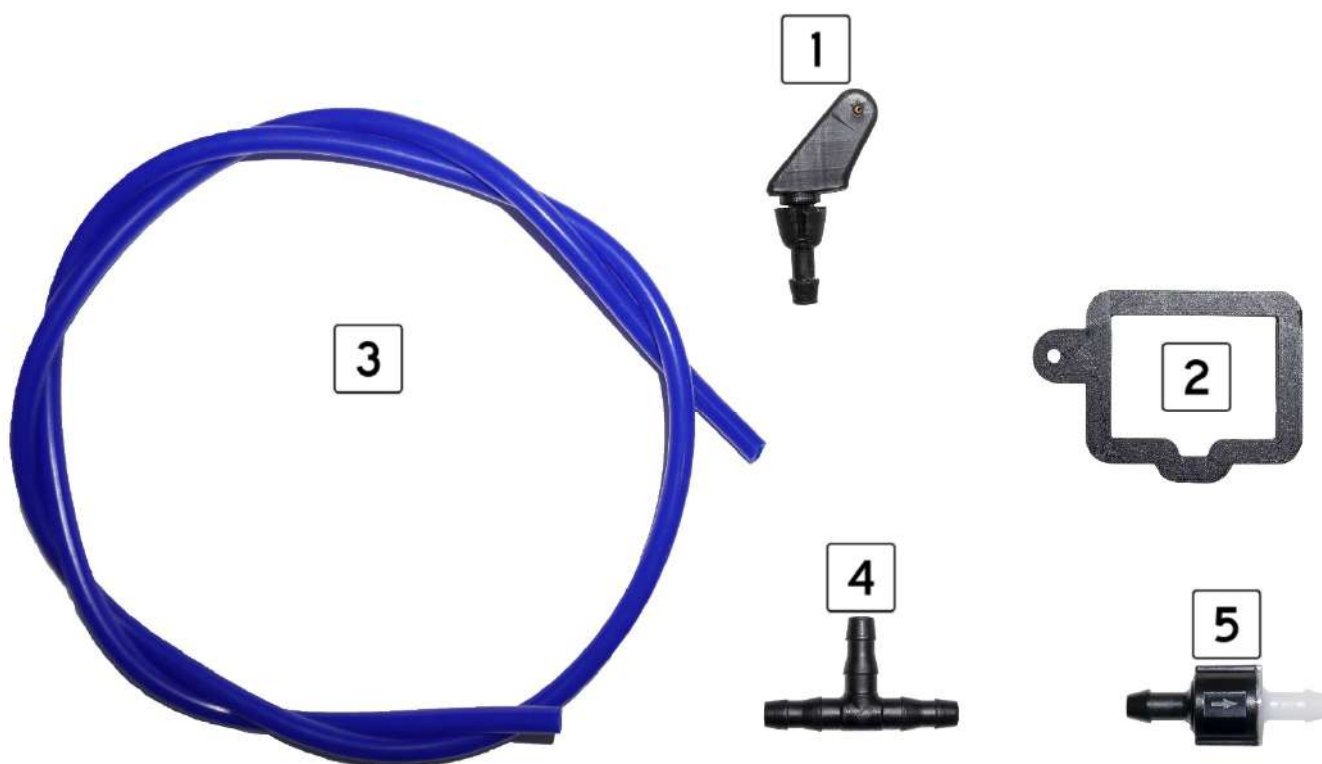
Рисунок 1 – Комплект поставки

В комплект поставки входят следующие элементы (рис. 1):