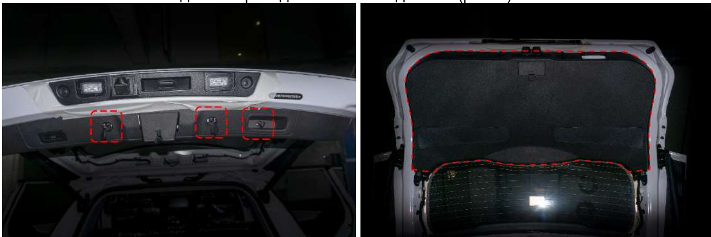
Рисунок 4 – Расположение винтов крепления центральной накладки

3. Снять центральную накладку → отщелкнуть защитные колпачки и открутить три винта крепления «+PH2» → отсоединить провод питания от подсветки (рис. 4).