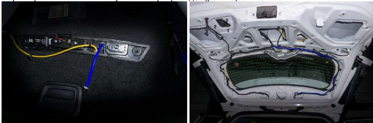
Рисунок 11 – Расположение трубки

4. Отрезать трубку длиной не более 10 см → подсоединить к форсунке и зафиксировать → установить обратный клапан. Проложить трубку к месту подключения форсунки омывателя → трубку зафиксировать к штатным жгутам электропроводки (рис. 11).