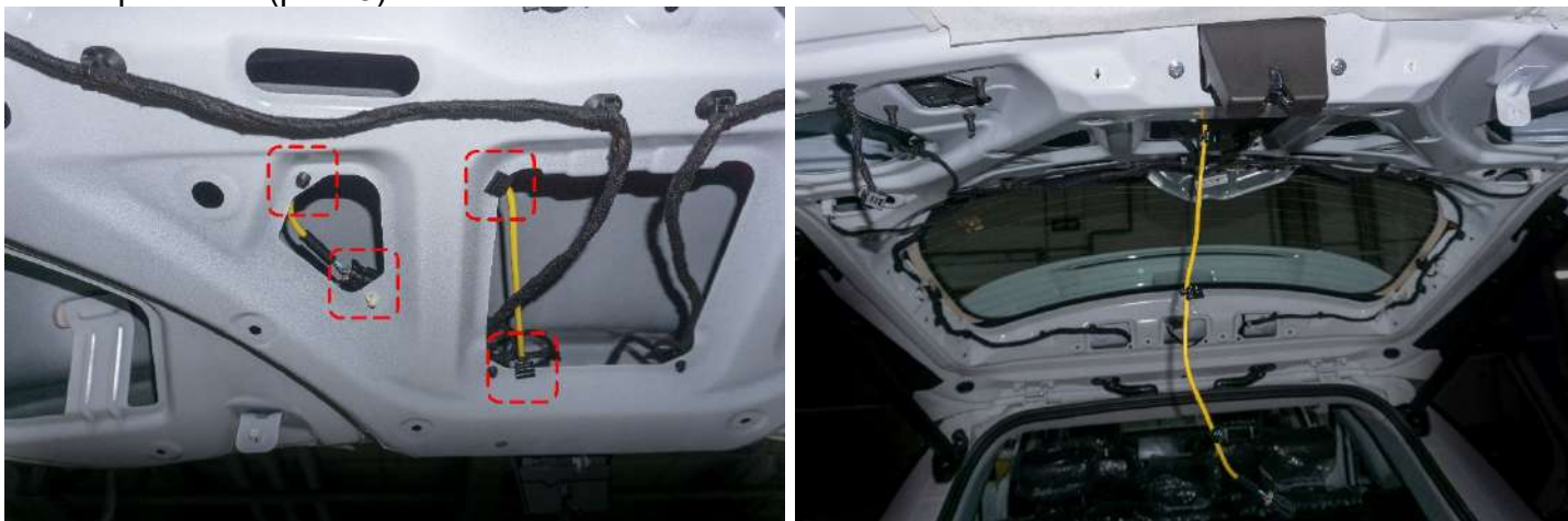
Рисунок 5 – Расположение клипс крепления

4. Отщелкнуть клипсы крепления провода от корпуса автомобиля → отсоединить провод питания от разъема (рис. 5).