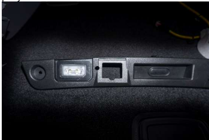
Рисунок 8 – Установка шаблона