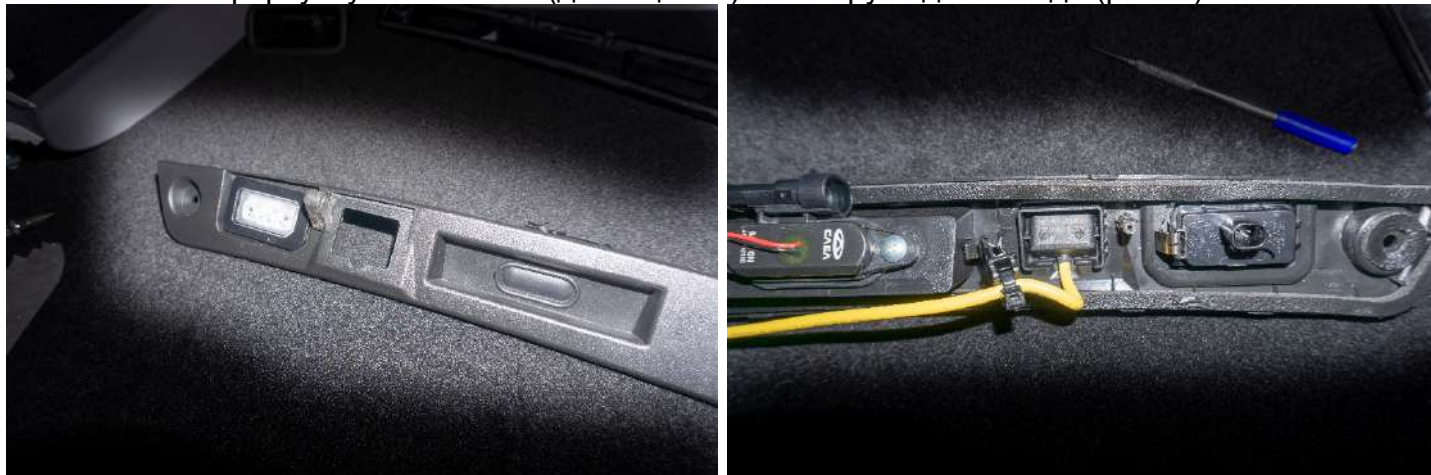
Рисунок 9 – Расположение форсунки омывателя

2. Установить форсунку омывателя (до защелки) и камеру заднего вида (рис. 9).