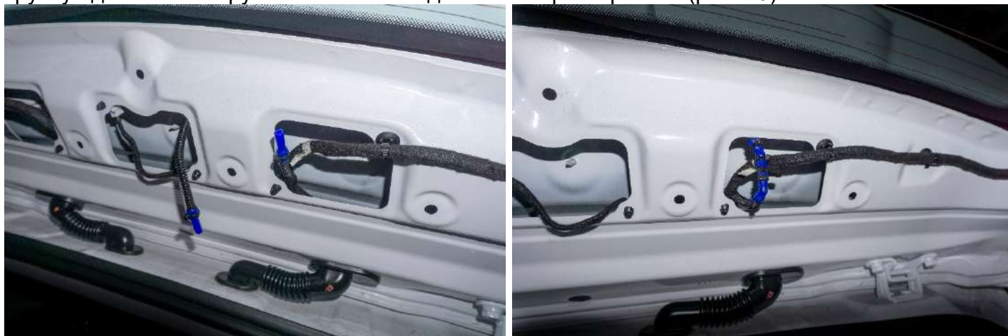
Рисунок 10 – Расположение фитинга тройника

3. Установить фитинг тройник в разрыв трубки на подачу жидкости, предварительно на штатную трубку одев по 2 см трубки → места соединений зафиксировать (рис. 10).