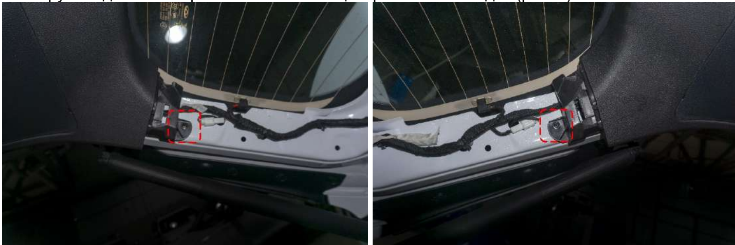
Рисунок 3 – Расположение винтов крепления центральной накладки

2. Открутить два винта крепления «+PH2» центральной накладки (рис. 3).