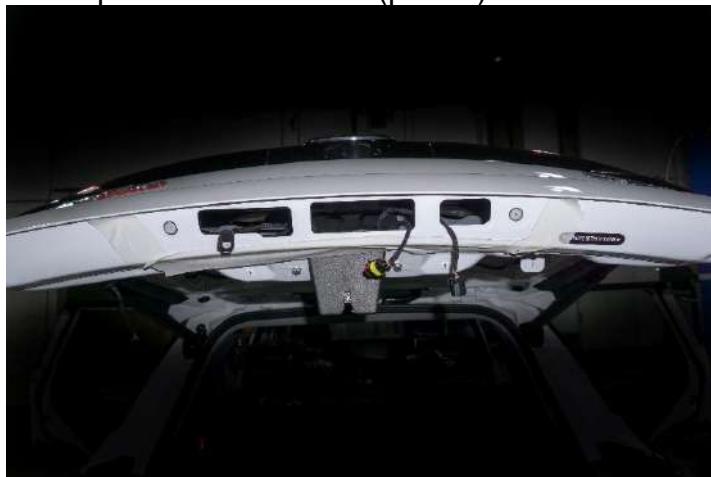
Рисунок 6 – Расположение винтов крепления

6. Снять камеру заднего вида с внешней наклейки → нажав на фиксаторы сбоку (рис. 7).