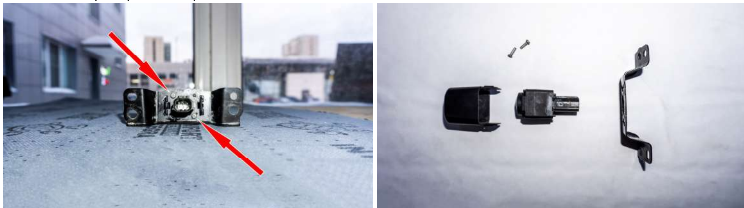
Рисунок 5 – Расположение винтов крепления