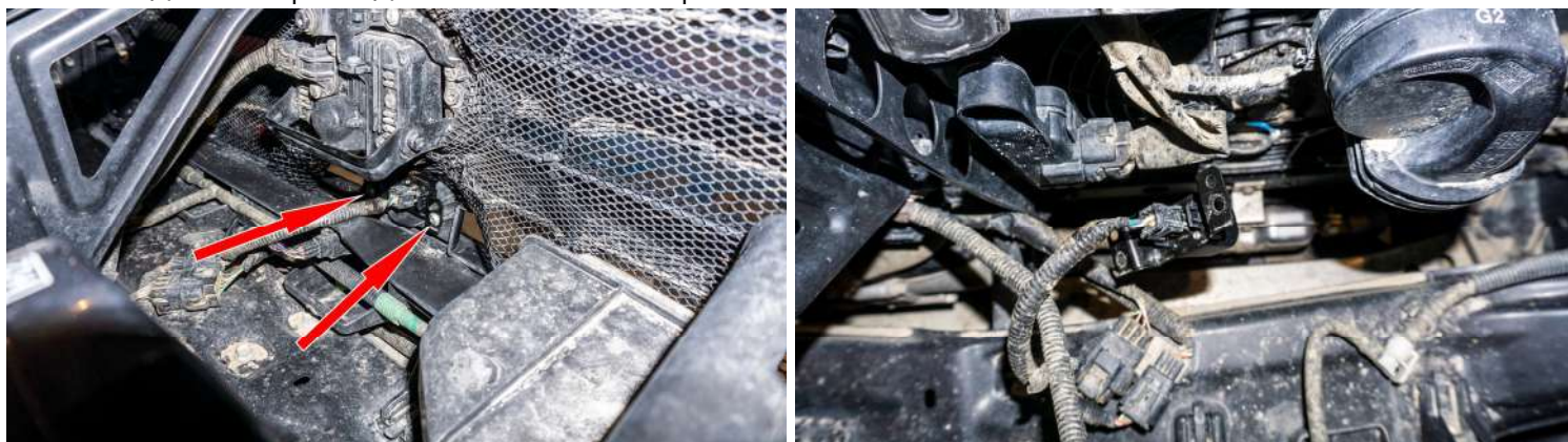
Рисунок 4 – Расположение винтов крепления корпуса

3. Снять камеру переднего вида с корпуса (рис. 5):