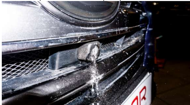
Рисунок 7 – Общий вид омывателя для камеры переднего вида

3. Проверить работоспособность на экране монитора, чтобы форсунка омывала полностью камеру (рис. 8).