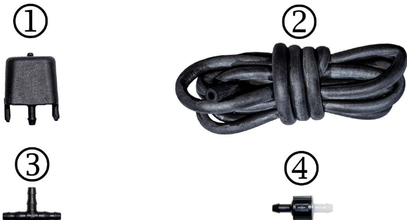
Рисунок 1 – Комплектация

В комплект поставки входят следующие элементы (рис. 1):