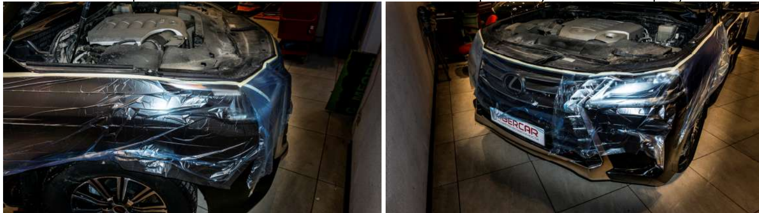
Рисунок 2 – Защитные действия