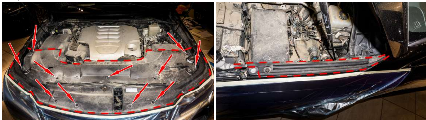
Рисунок 3 – Расположение клипс крепления

Также снять защитную накладку с правой стороны автомобиля, отщелкнув клипсы крепления.