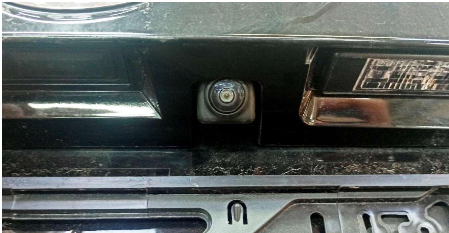
Штатная камера заднего вида