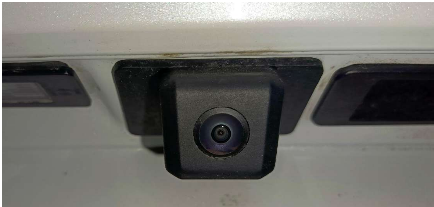
Штатная камера заднего вида