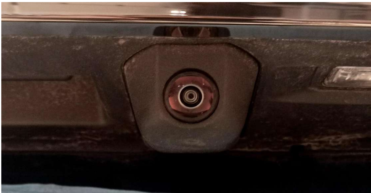
Штатная камера заднего вида