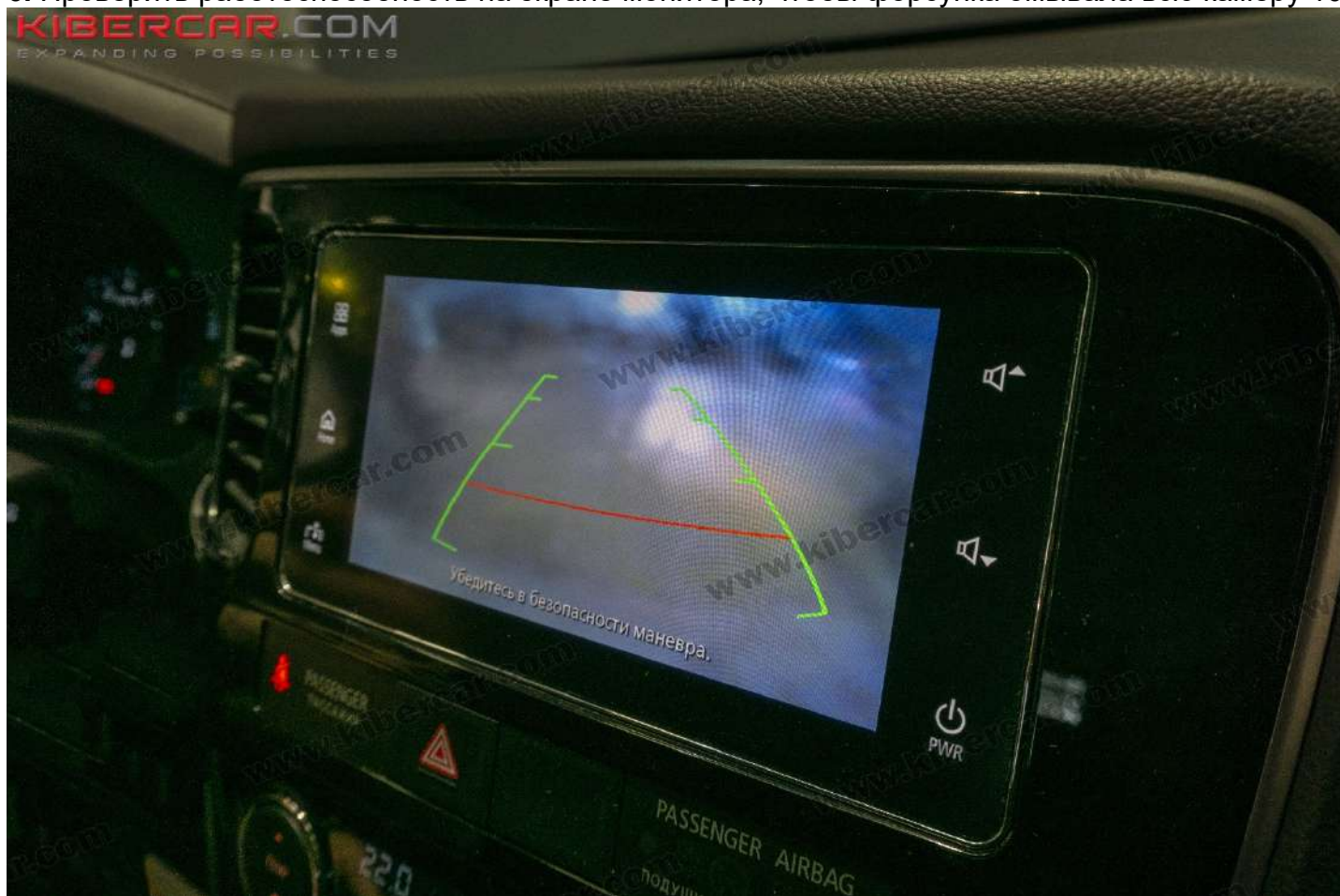
Рисунок 10 – Общий вид на экране монитора

6. Проверить работоспособность на экране монитора, чтобы форсунка омывала всю камеру 10.