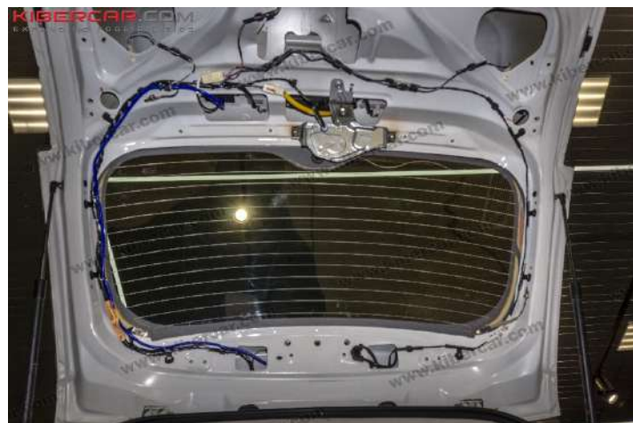
Рисунок 8 – Расположение трубки в багажном отделении