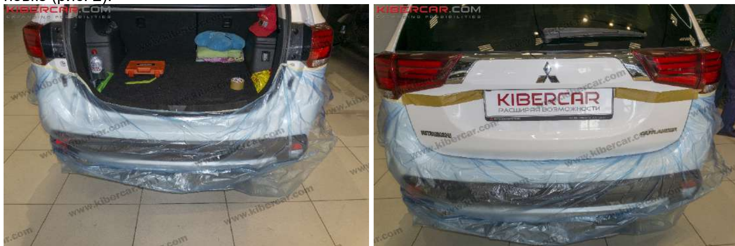
Рисунок 2 – Расположение декоративной наклейки двери