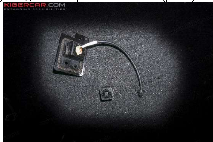
Рисунок 6 – Расположение винтов крепления