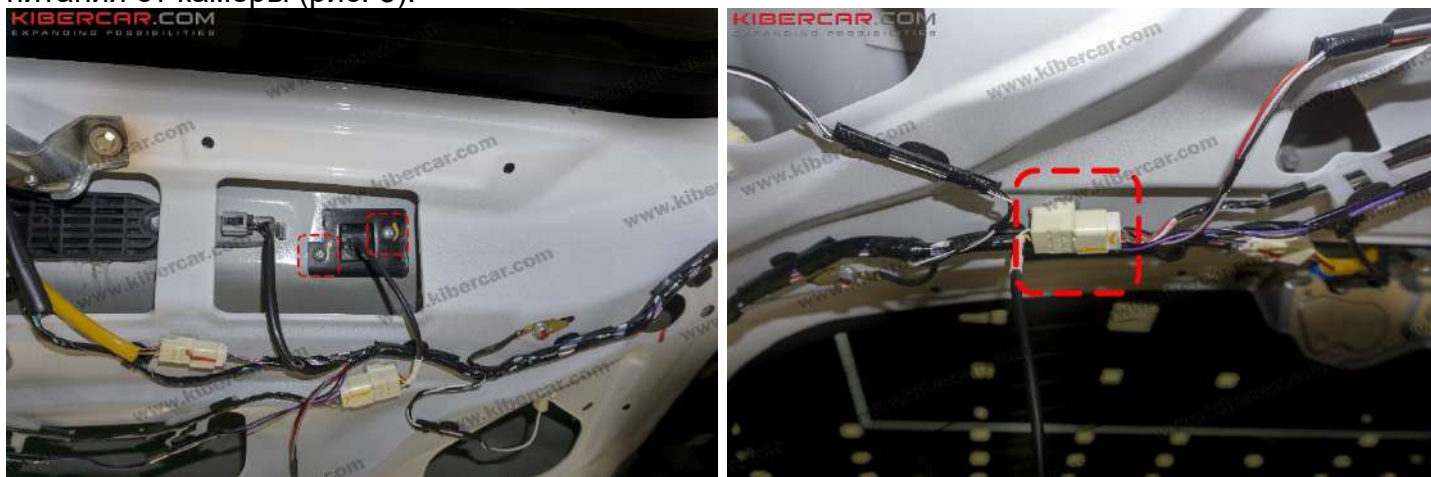
Рисунок 5 – Расположение винтов крепления камеры заднего вида

3. Снять камеру заднего вида → открутить два винта крепления «+PH2» → отсоединить провод питания от камеры (рис. 5).