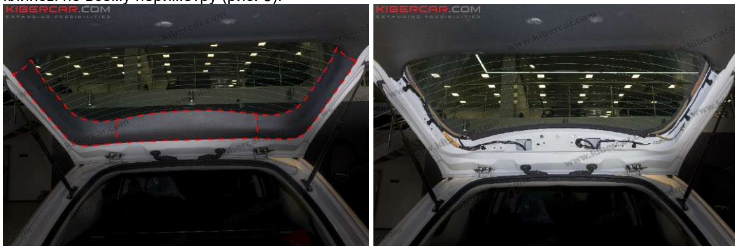
Рисунок 3 – Расположение декоративной накладки двери

1. Съемником [2] снять декоративные накладки двери багажного отделения → отщелкнуть клипсы по всему периметру (рис. 3).