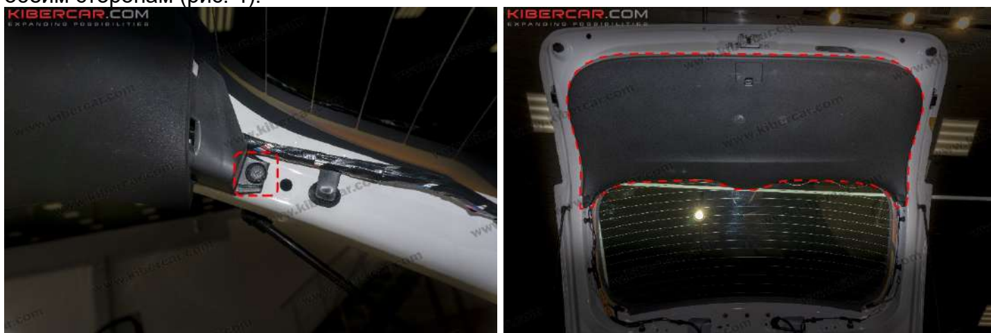
Рисунок 4 – Расположение фиксаторов крепления центральной накладки

2. Снять центральную накладку → снять два фиксатора крепления центральной накладки, по обеим сторонам (рис. 4).