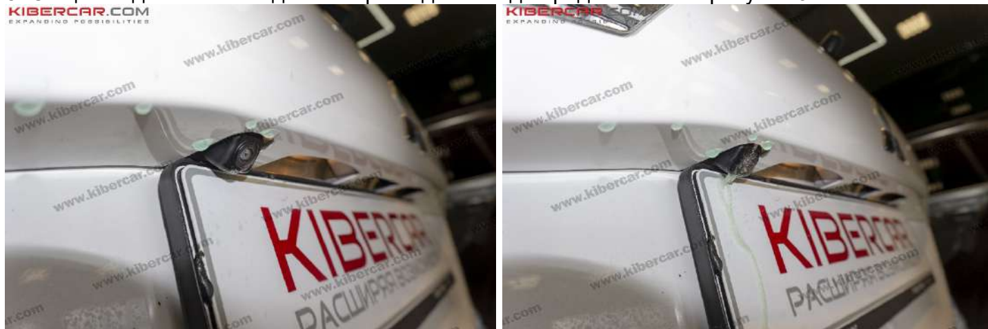
Рисунок 9 – Общий вид форсунки омывателя для камеры заднего вида

5. Общий вид омывателя для камеры заднего вида представлен на рисунке 9.