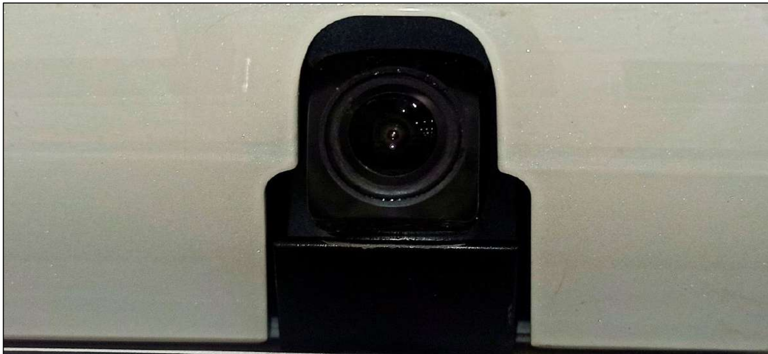
Штатная камера заднего вида