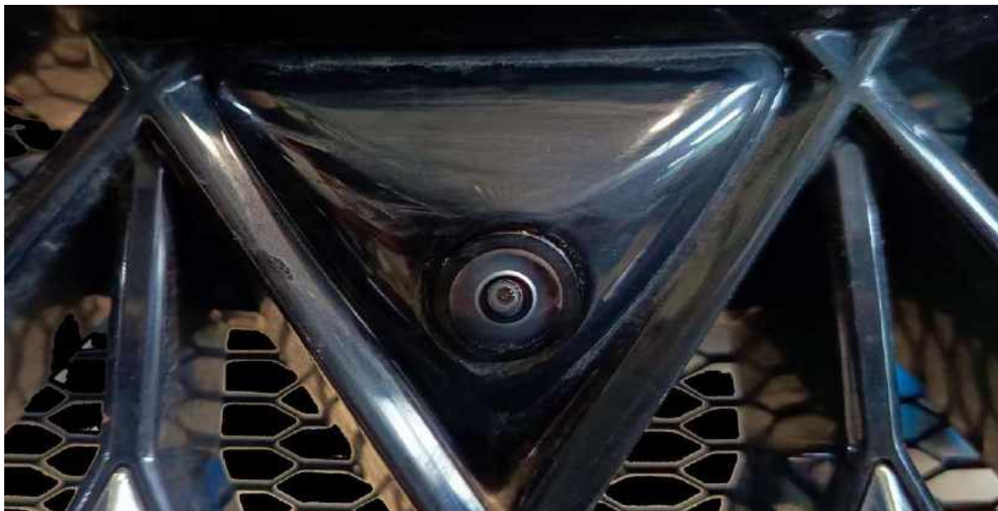
Штатная камера заднего вида