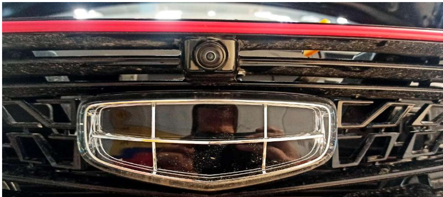
Штатная камера заднего вида