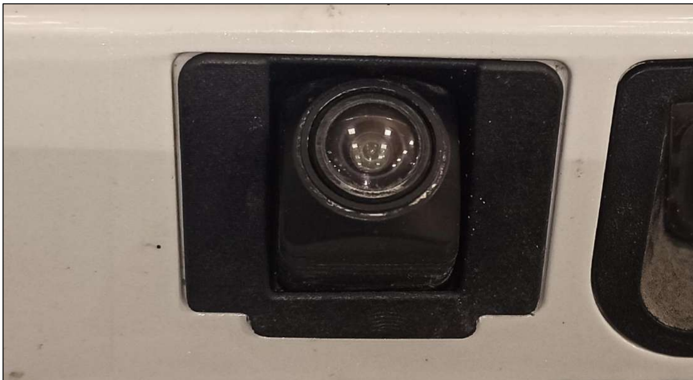
Штатная камера заднего вида