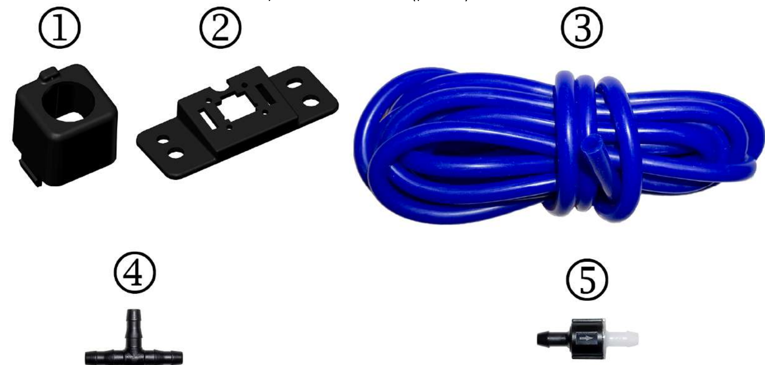
Рисунок 1 – Комплектация

В комплект поставки входят следующие элементы (рис. 1):