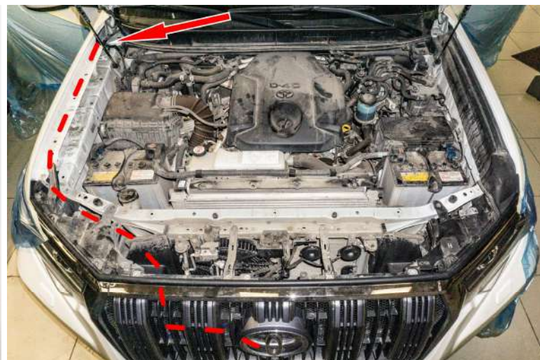
Рисунок 2 – Расположение фитинга тройника и трубки в подкапотном пространстве