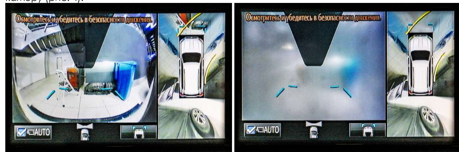
Рисунок 4 – Общий вид на экране монитора

2. Проверить работоспособность на экране монитора, чтобы форсунка омывала полностью камеру (рис. 4).