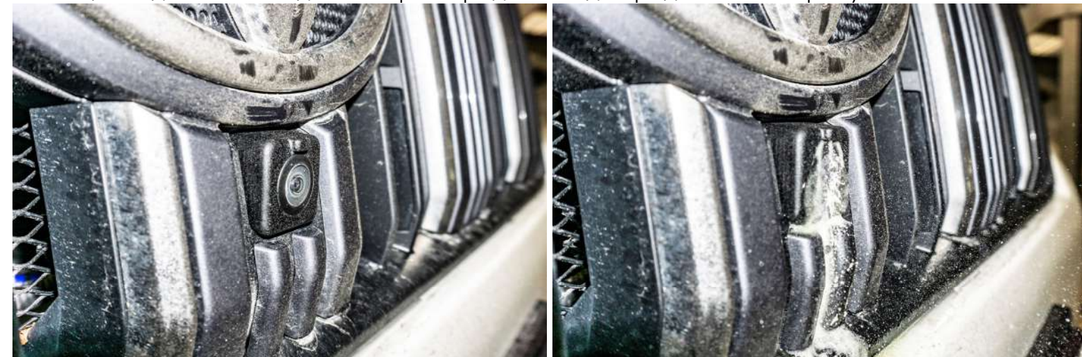
Рисунок 3 – Общий вид омывателя для камеры переднего вида

1. Общий вид омывателя для камеры переднего вида представлен на рисунке 3.