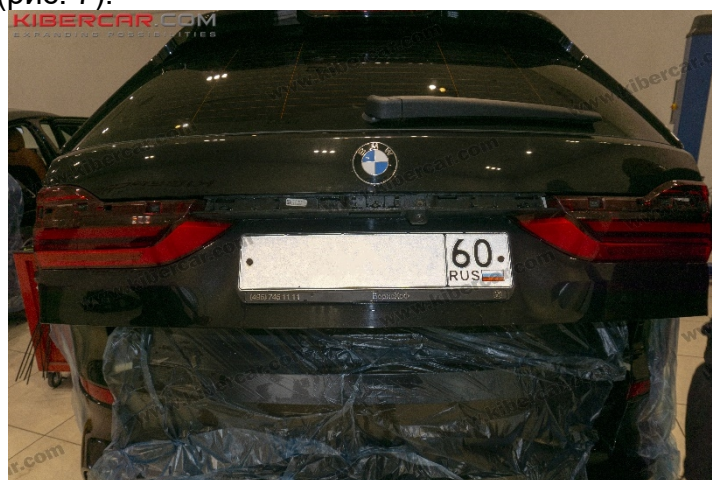
Рисунок 7 – Расположение хромированной декоративной накладки

6. Открутить винт «★Torx T20» крепление корпуса камеры заднего вида → отсоединить провод от камеры (рис. 8).