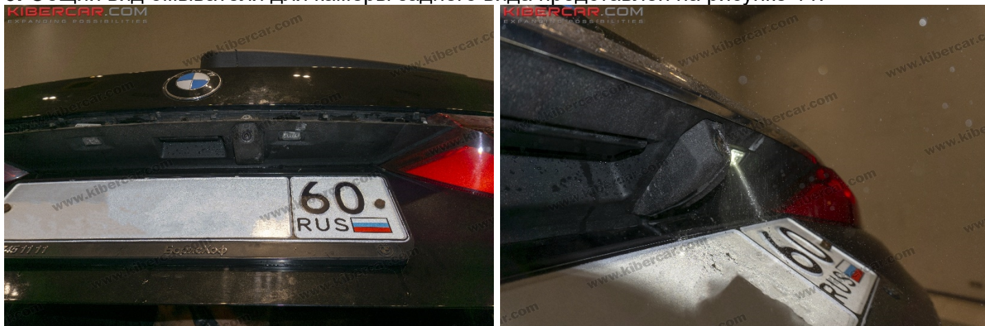
Рисунок 11 – Общий вид омывателя для камеры заднего вида

3. Общий вид омывателя для камеры заднего вида представлен на рисунке 11.