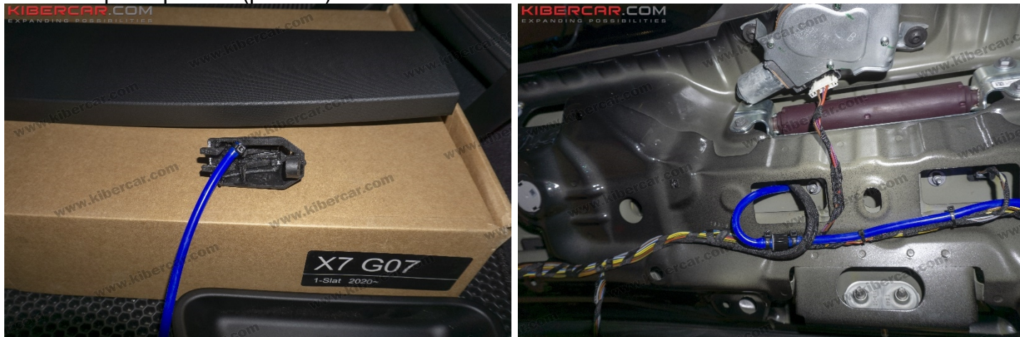
Рисунок 10 – Установка омывателя

2. Подсоединить трубку к форсунке омывателя и установить обратный клапан → места соединений зафиксировать (рис. 10).