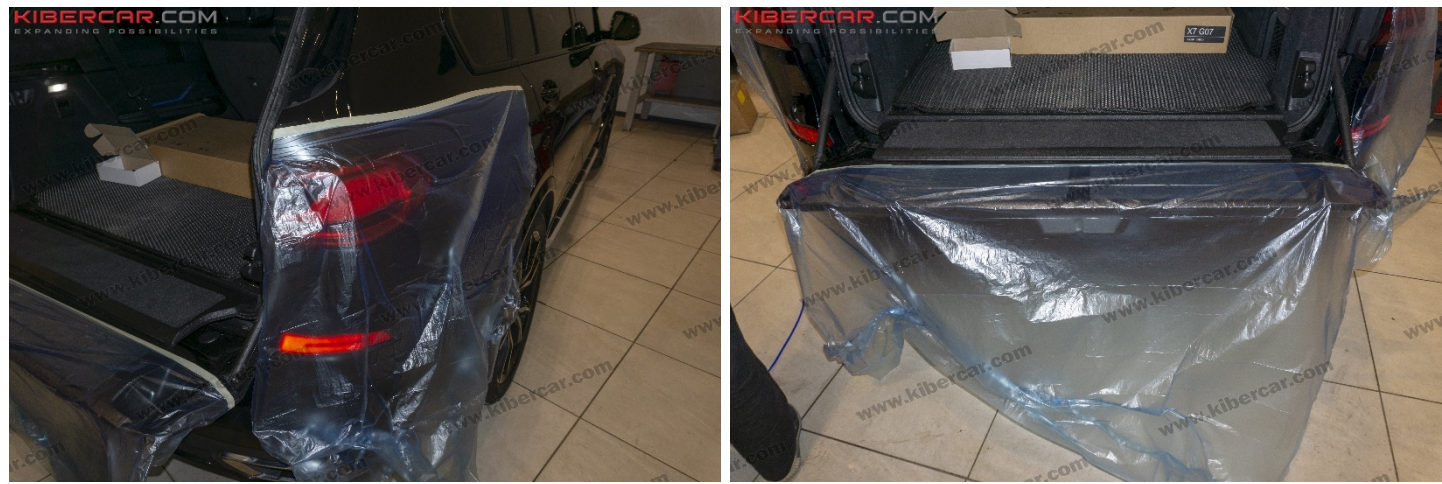
Рисунок 2 – Защитные действия