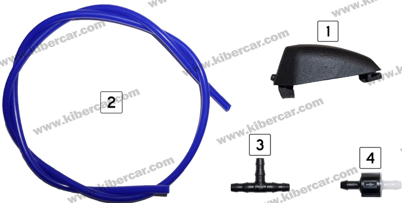
Рисунок 1 – Комплект поставки