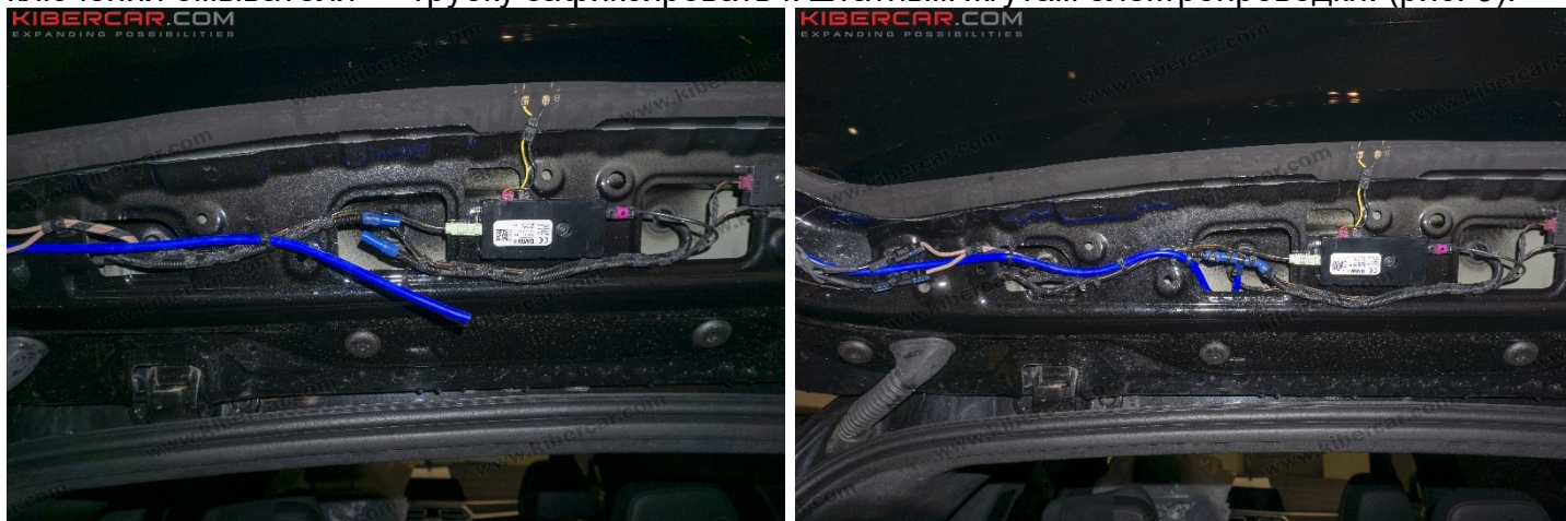
Рисунок 9 – Расположение фитинга тройника

1. Установить фитинг тройник в разрыв трубки на подачу жидкости, предварительно на штатную трубку одев по 2 см трубки → места соединений зафиксировать. Проложить трубку к месту подключения омывателя → трубку зафиксировать к штатным жгутам электропроводки. (рис. 9).