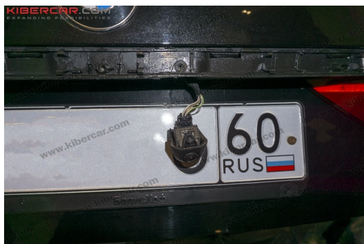
Рисунок 8 – Расположение винта крепления