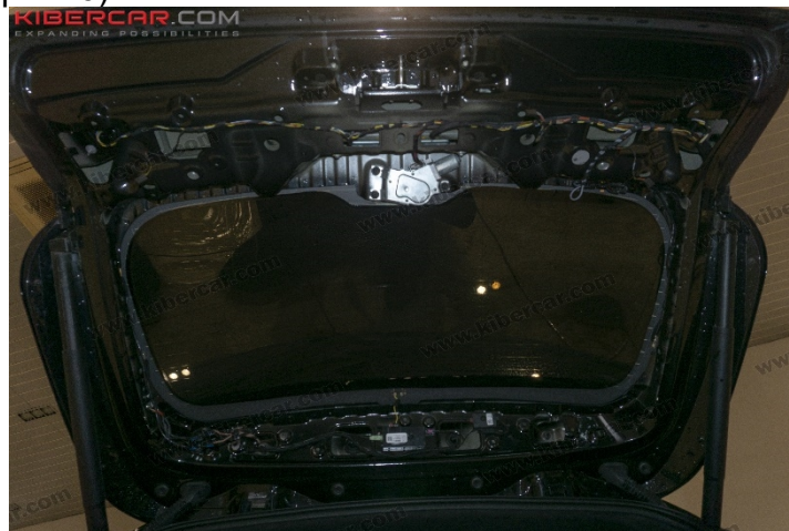
Рисунок 6 – Расположение винтов крепления

5. Снять съемником хромированную декоративную накладку, отклеить накладку с левого и правого угла, далее отщелкнуть клипсы по центру (рис. 7).