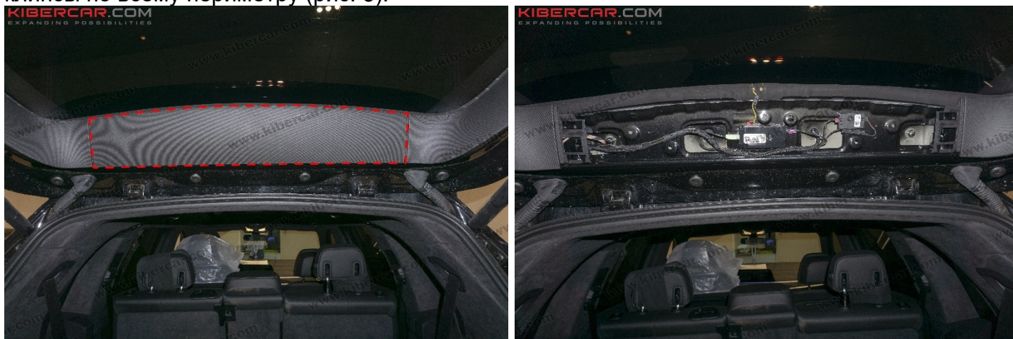
Рисунок 3 – Расположение декоративной накладки двери

1. Съемником [2] снять декоративную накладку двери багажного отделения → отщелкнуть клипсы по всему периметру (рис. 3).