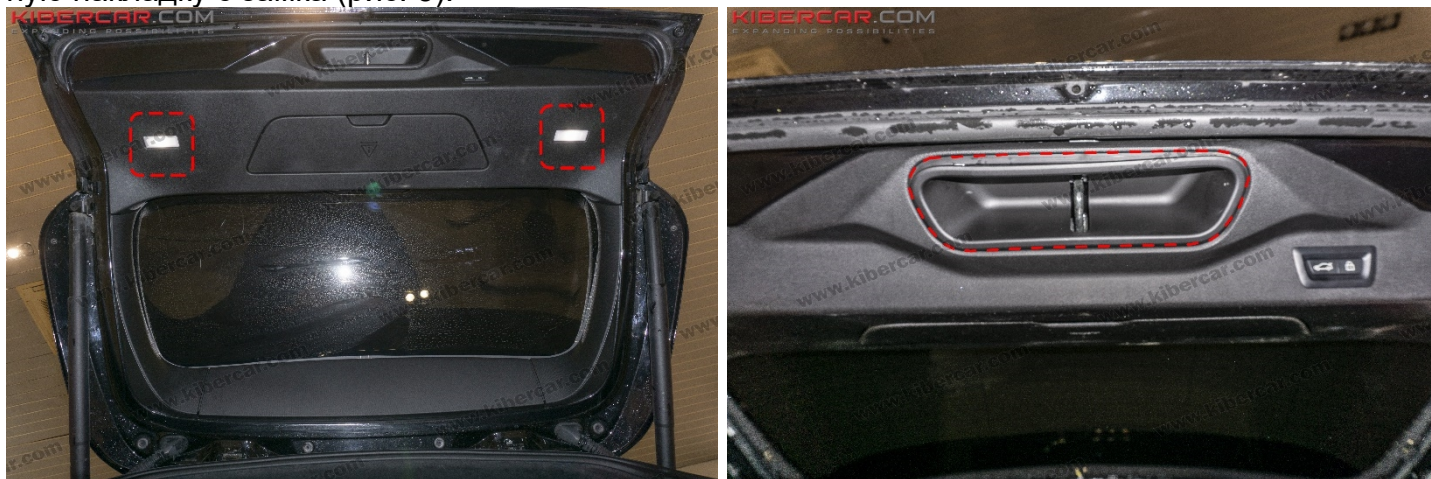
Рисунок 5 – Расположение накладки замка

3. Съемником снять две лампы освещения → отсоединить провода питания. Снять декоративную накладку с замка (рис. 5).