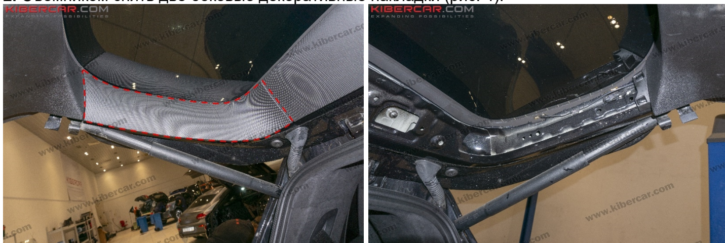
Рисунок 4 – Расположение боковой накладки

2. Съемником снять две боковые декоративные накладки (рис. 4).