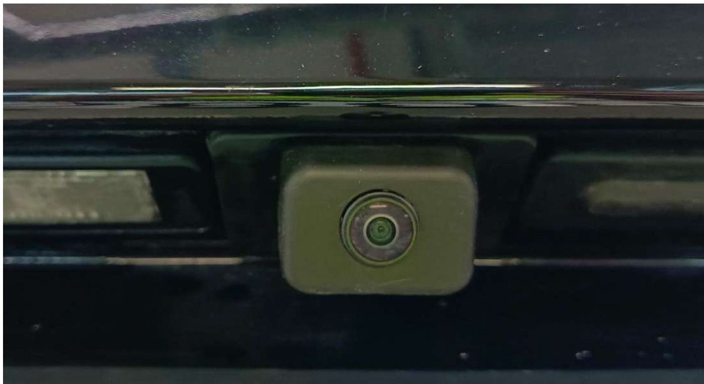
Штатная камера заднего вида