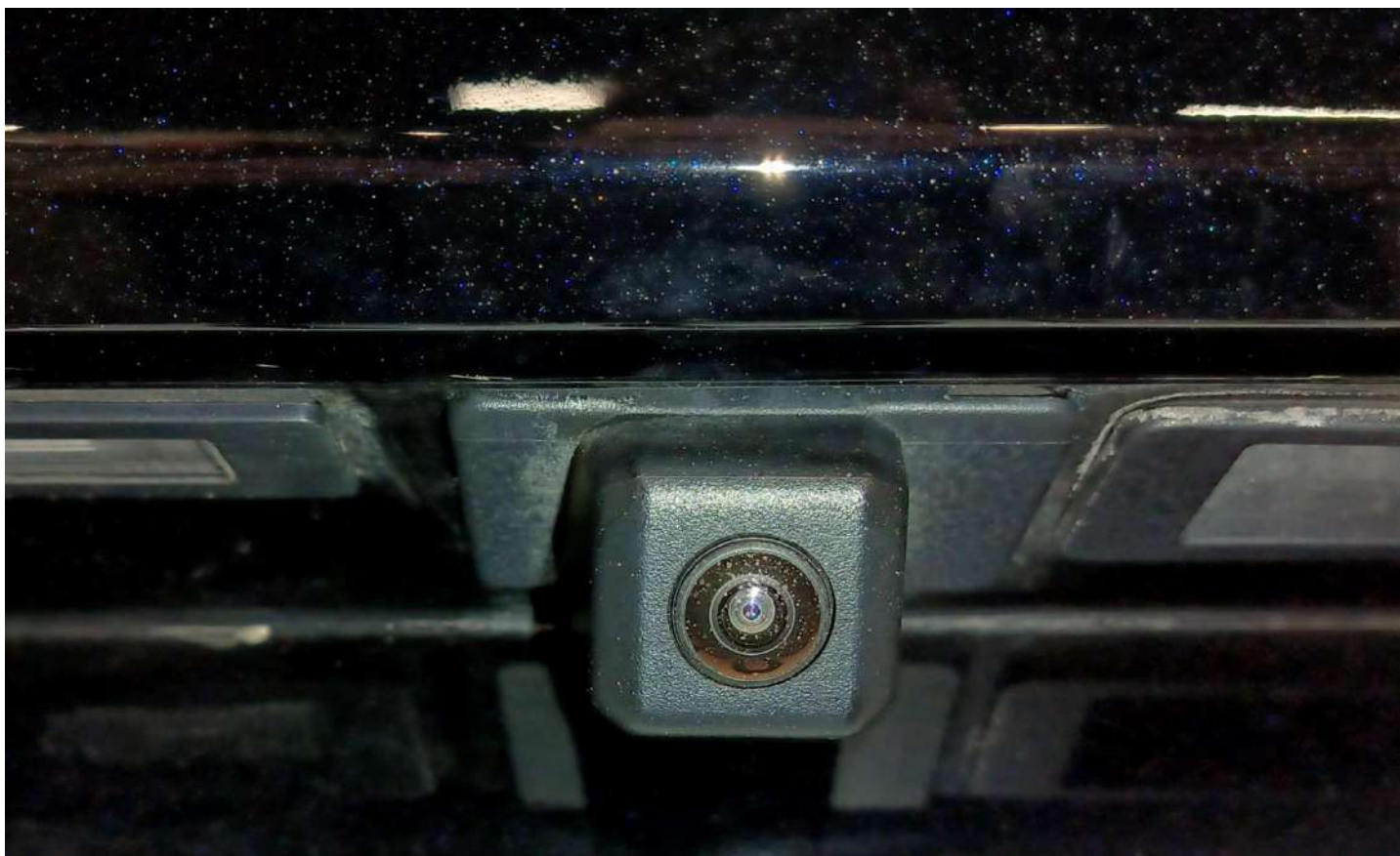
Штатная камера заднего вида