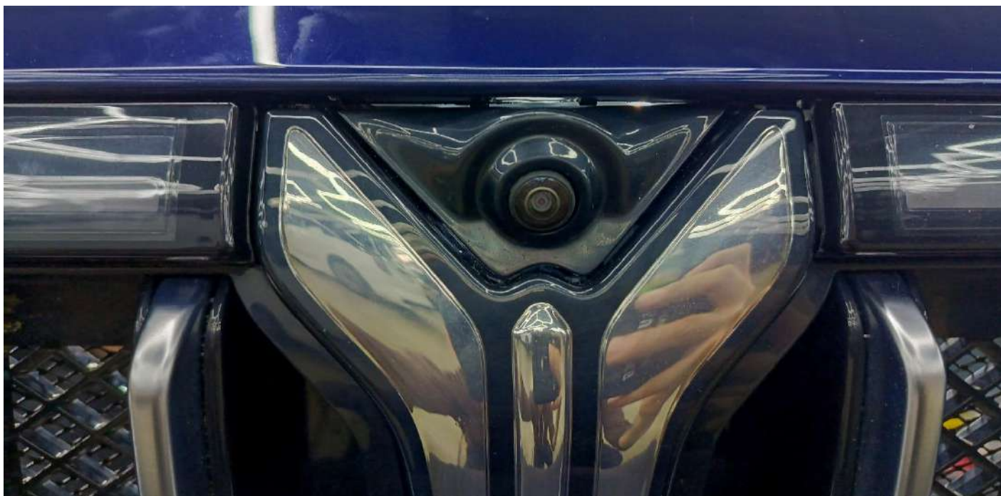
Штатная камера заднего вида